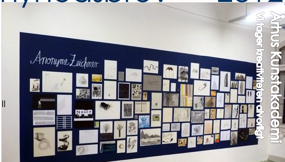
Fra Anke Beckers udstilling i Zürich i december 2011